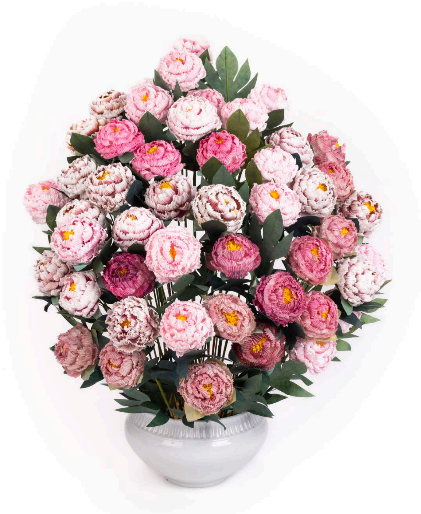
김연진지화장 지도 (능인스님, 김형자, 최정숙, 김혜양)