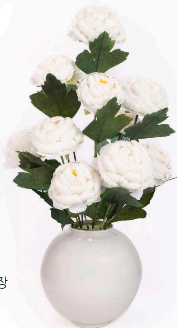
명예이사 이금주 지화장