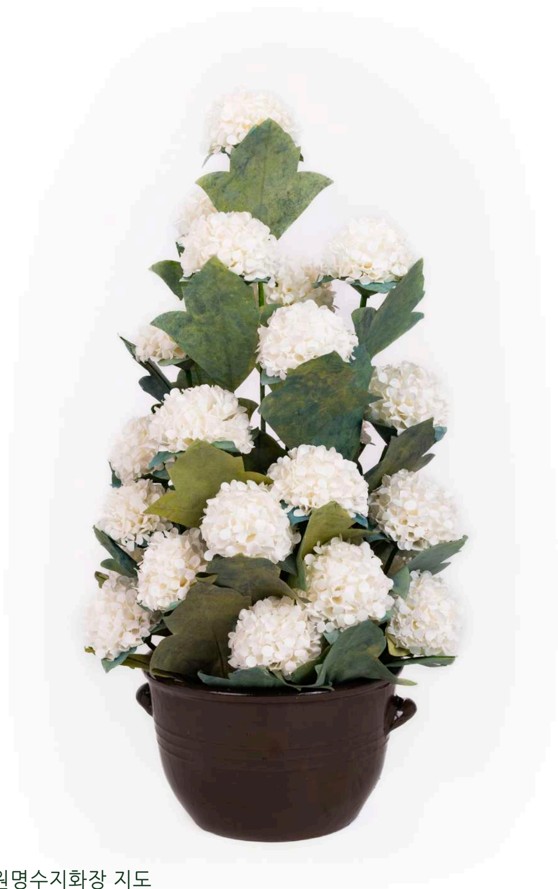
원명수지화장 지도 (박영숙, 허준, 강영순, 김난수, )