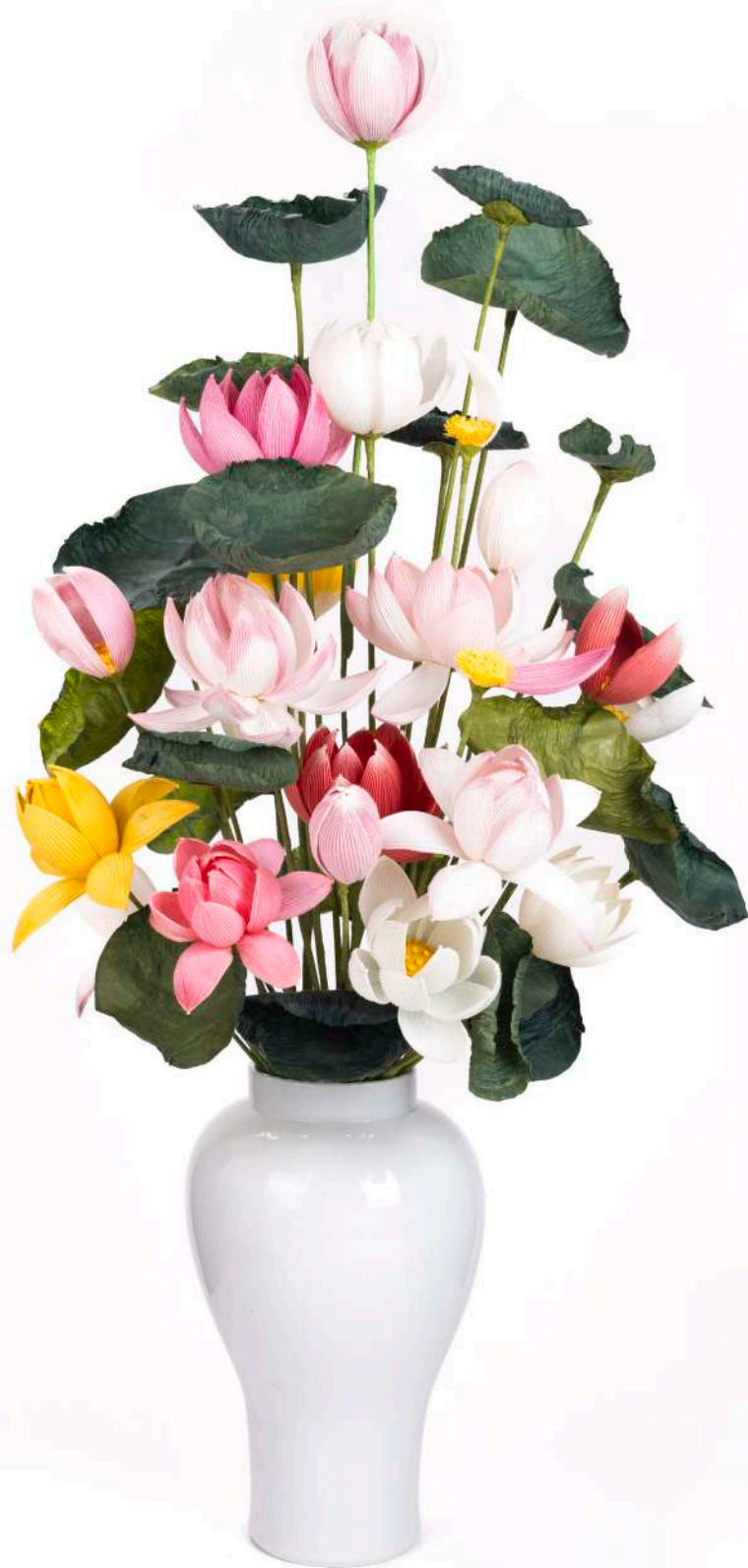
고영신지화장 지도 (주은영, 김복실, 윤금섭, 김황산)