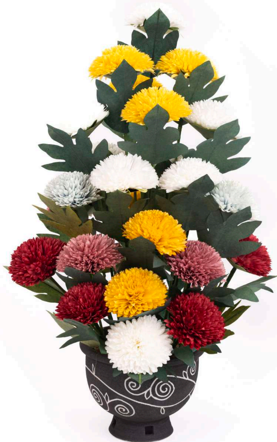
이선화지화장 지도 (자운스님, 이정윤, 김문옥)