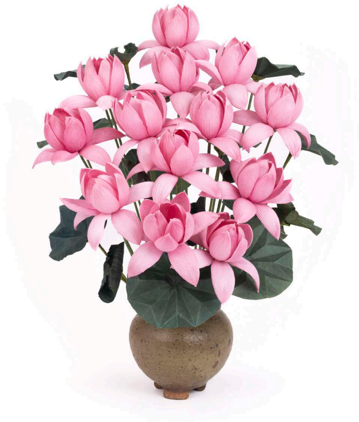
명예이사 재무 고영신 지화장